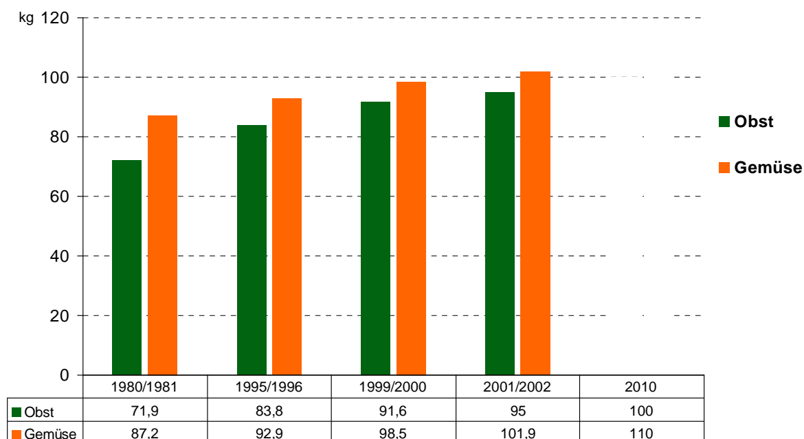
Abbildung 2: Entwicklung des Pro-Kopf-Verbrauches von Obst und Gemüse in Österreich (in kg)

Gemäß Statistik nimmt jeder Österreicher pro Jahr im Durchschnitt 95 kg Obst und 101,9 kg Gemüse zu sich – Tendenz steigend.