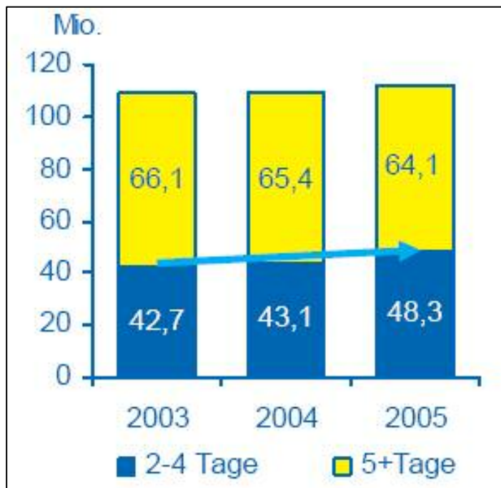
Abbildung 2: Urlaubs- und Kurzurlaubsreisen in Mio.

Fast drei Viertel der Deutschen haben 2005 mindestens eine Urlaubsreise (ab 5 Tagen Dauer) unternommen. Insgesamt wurden 64,1 Mio. Urlaubsreisen durchgeführt. Dies entspricht einem leichten Rückgang, dem allerdings ein recht deutliches Wachstum bei den Kurzurlaubsreisen (2 bis 4 Tage Dauer) gegenübersteht. Die Analyse der Daten zeigt, dass die Urlaubsreiseintensität bei den unteren und mittleren Einkommensgruppen und den Ostdeutschen leicht zurückgegangen ist, während die Kurzurlaubsreiseintensität gerade bei diesen Gruppen im letzten Jahr gestiegen ist. Es sieht so aus, dass ein Teil dieser Bevölkerungsgruppen anstelle von Urlaubsreisen im letzten Jahr Kurzurlaubsreisen unternommen hat. Abgesehen von diesen marginalen Verschiebungen gilt aber auch für 2005: die touristische Nachfrage ist insgesamt weiterhin ausgesprochen stabil!